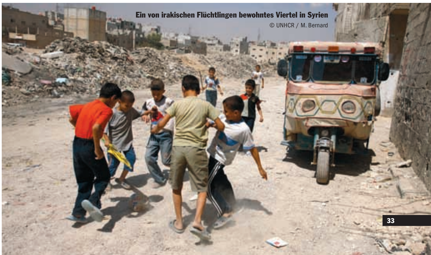
Ein von irakischen Flüchtlingen bewohntes Viertel in Syrien